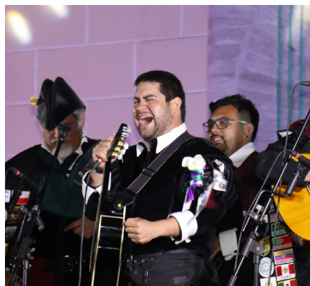
Una jornada de música para repetir, porque agradó de gran manera a los andacollinos.