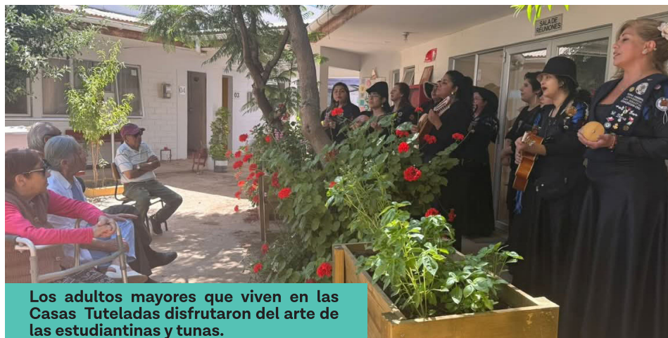
Los adultos mayores que viven en las Casas Tuteladas disfrutaron del arte de las estudiantinas y tunas.