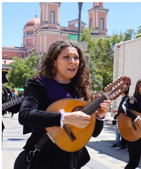
Un pasa calle al ritmo de las tunas vivió la comunidad.