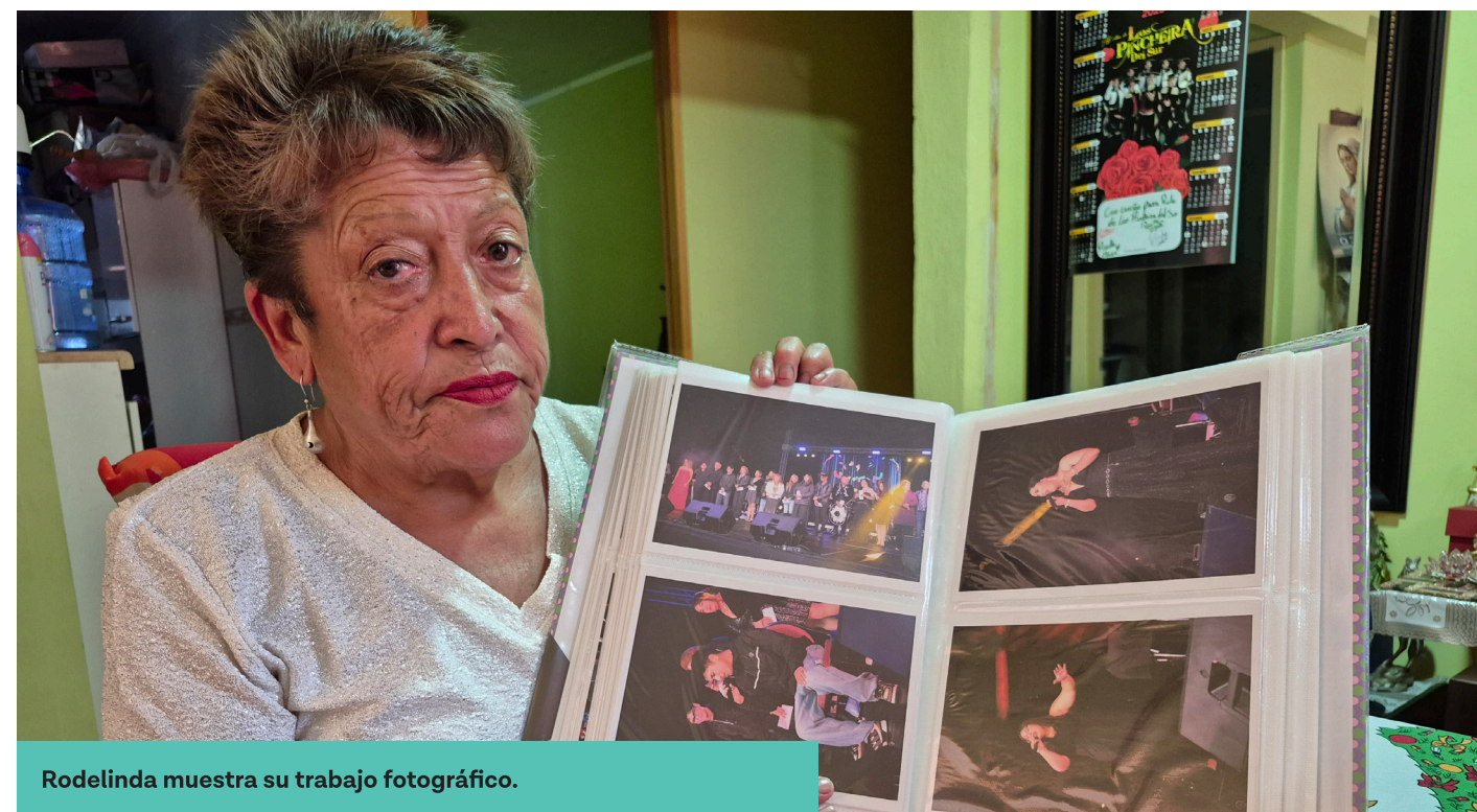
Rodelinda muestra su trabajo fotográfico.

La fotografía llegó a su vida por necesidad. Quería una foto de su hijo, pero el fotógrafo de la plaza no quiso