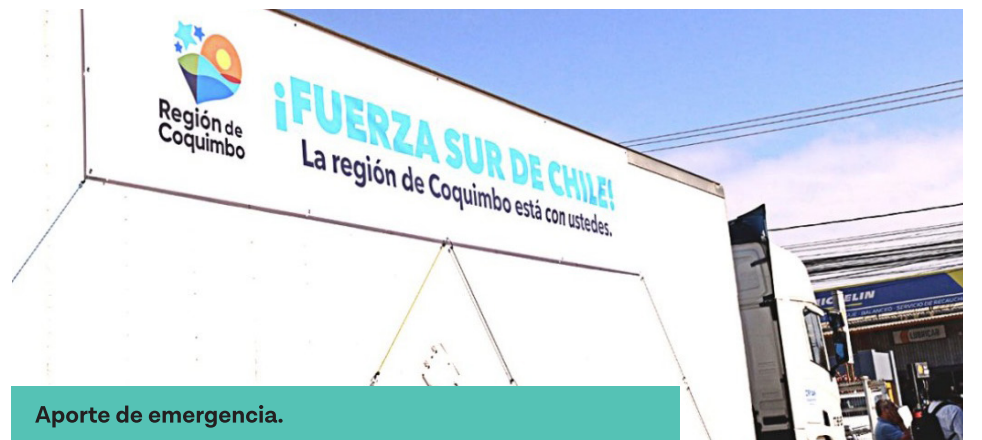
Aporte de emergencia.

Para Teck CDA, el compromiso con las comunidades va más allá de los