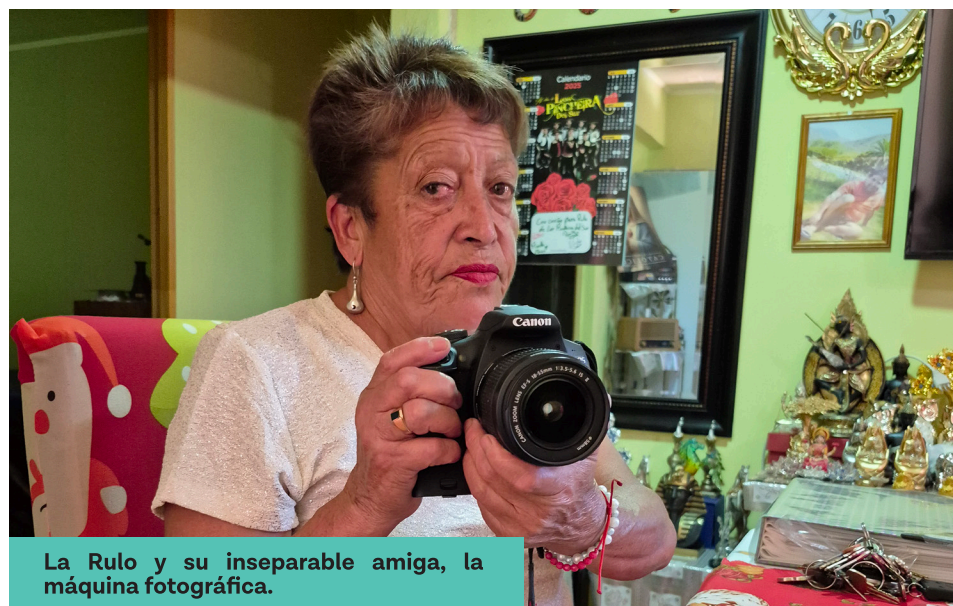
La Rulo y su inseparable amiga, la máquina fotográfica.