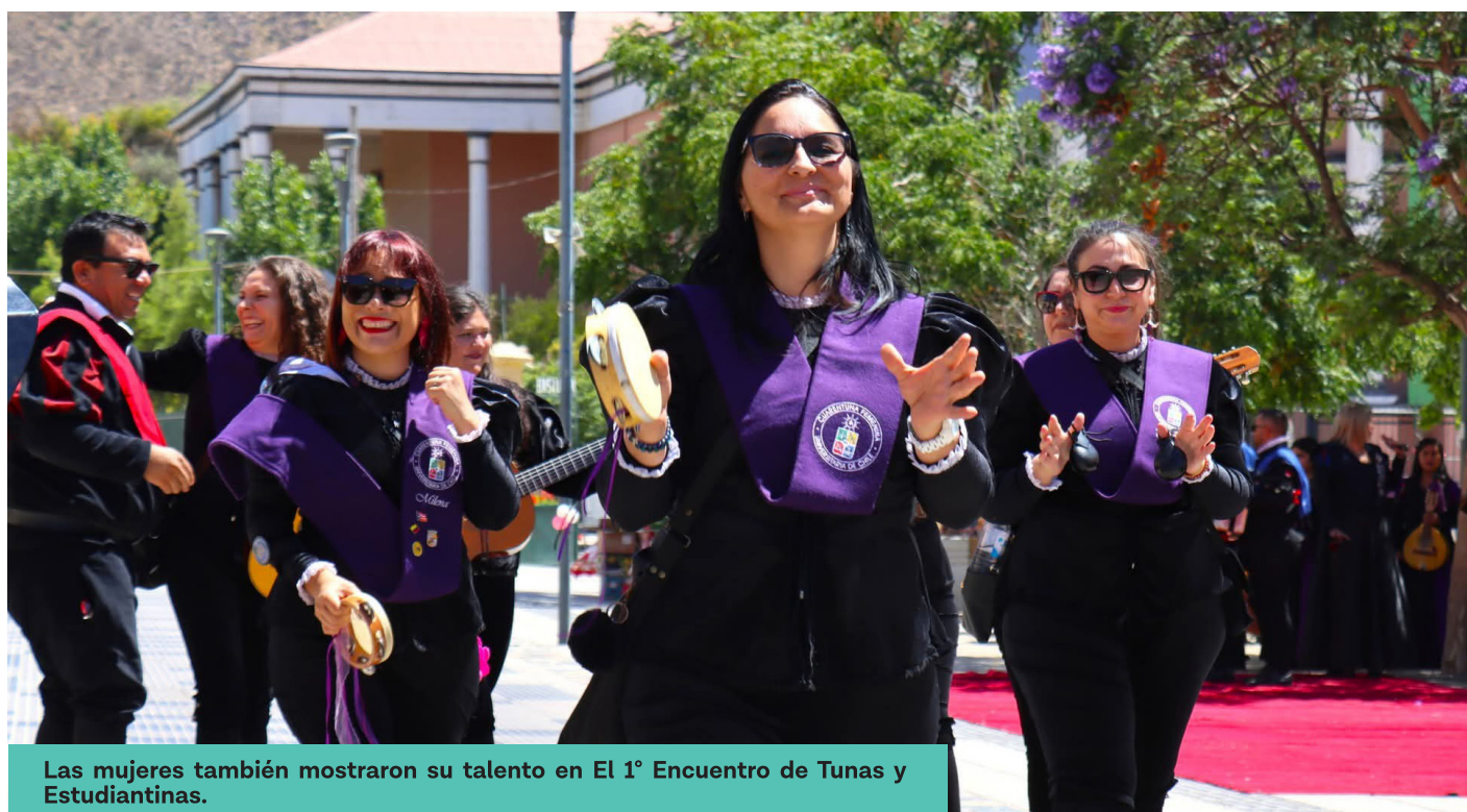
Las mujeres también mostraron su talento en El 1° Encuentro de Tunas y Estudiantinas.