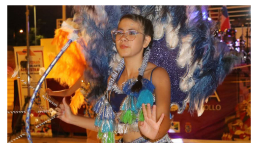
Las danzas y colores fueron muy aplaudidos.

La dirigente destacó además la alta participación de la comunidad y el impacto positivo de este tipo de iniciativas que permiten acercar el arte ancestral andino a los distintos