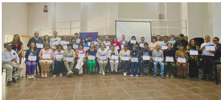
Más de 40 asistentes tuvo la capacitación de Patrimonio.