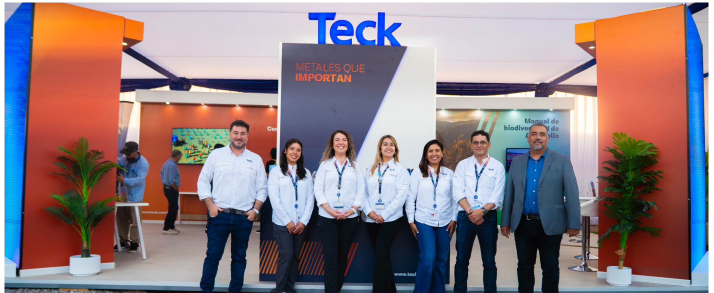
Comunicaciones, Gestión Comunitaria, Recursos Humanos y Medio Ambiente fueron parte de los equipos que recibieron al público asistente.

Uno de los principales atractivos del stand fue el simulador de Camiones Mineros (CAEX), experiencia que convocó a adultos, jóvenes y niños, quienes pudieron comprender de forma interactiva cómo se desarrollan las labores de transporte al interior de la mina, reforzando el componente educativo y formativo de la participación de Teck CDA en la feria. A ello se sumó la exhibición de un video en formato 360°, que mostró el recorrido real de los camiones en sus tareas diarias dentro de la operación.