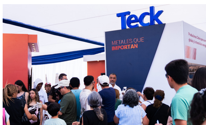
Público local y veraneantes conocieron más de Teck.

Cristóbal Juliá , gobernador de la Región de Coquimbo: “Hace tres años que no teníamos esta Expo. Estamos muy contentos porque tuvimos más de 200 emprendedores que mostraron las bondades de la Región de Coquimbo. Tuvimos las 15 comunas representadas, exponiendo cultura, arte y gastronomía. Esto demuestra que todos, trabajando en conjunto, podemos hacer cosas grandes, y esperamos que esto crezca en el futuro”.