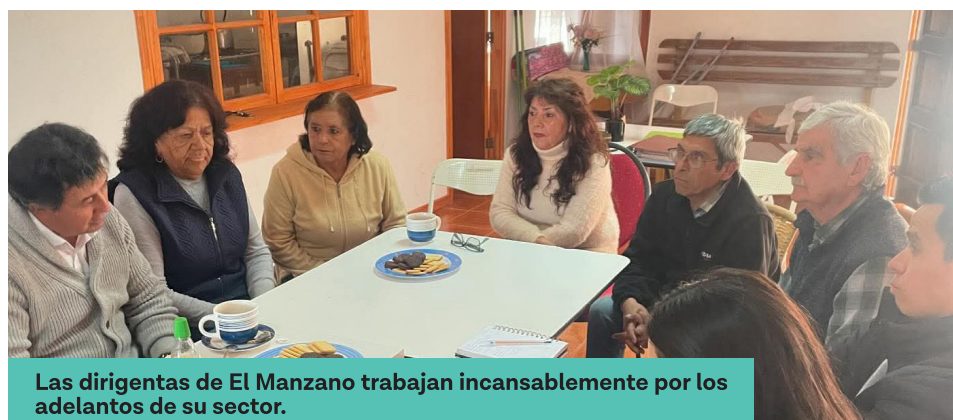
Las dirigentas de El Manzano trabajan incansablemente por los adelantos de su sector.

“Así, poco a poco vamos avanzando en los adelantos. Ahora veremos a qué proyecto de la Mesa CAT postulamos este año”, concluye la dirigente, reflejando el compromiso sostenido con el desarrollo de El Manzano.