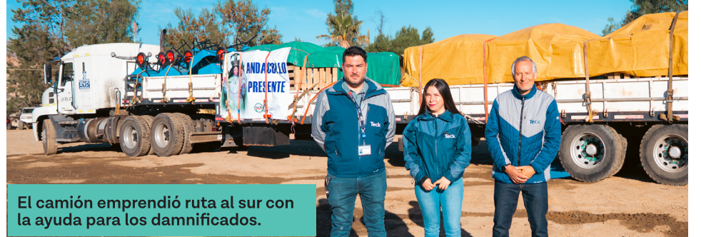
El camión emprendió ruta al sur con la ayuda para los damnificados.

La ayuda fue trasladada gracias al apoyo de la empresa RyD, que permitió el envío de cerca de 14 toneladas de alimentos, útiles de aseo, pañales, alimentos para mascotas y ropa nueva.