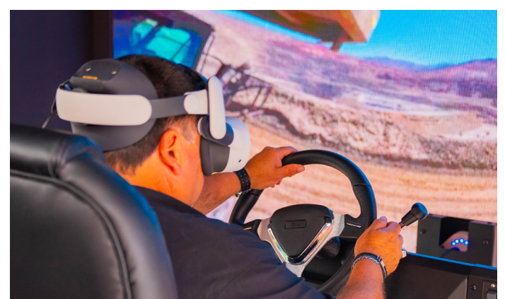
El simulador de un camión minero fue gran la atracción.