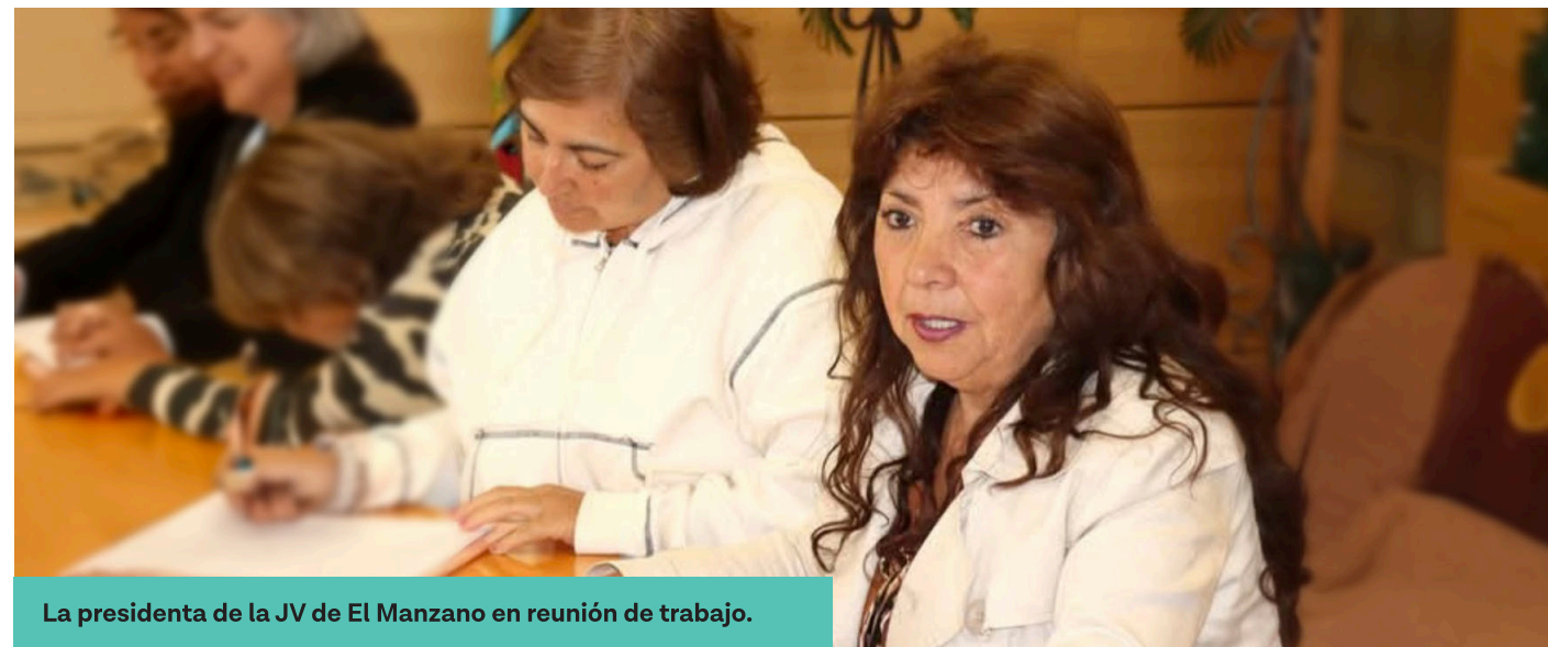
La presidenta de la JV de El Manzano en reunión de trabajo.