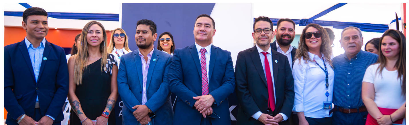
Autoridades regionales, encabezadas por el gobernador Cristóbal Juliá, visitando el stand de Teck.