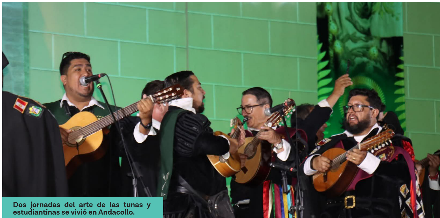
Dos jornadas del arte de las tunas y estudiantinas se vivió en Andacollo.