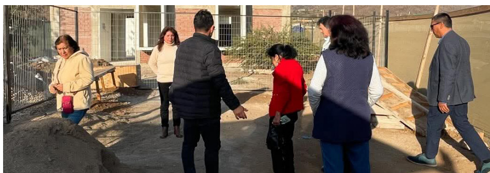
Los adelantos están llegando a El Manzano, pues se construye el Centro Médico Rural y se ponen focos solares para alumbrar la vía pública.