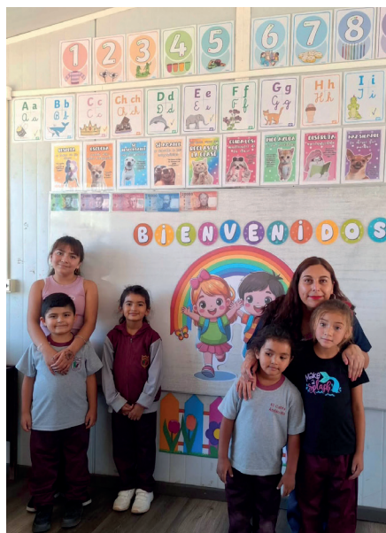
Escuela Domingo Santa María, de El Cobre.