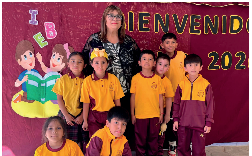
Los alumnos del Colegio San Lorenzo comenaron el año con mucha alegría