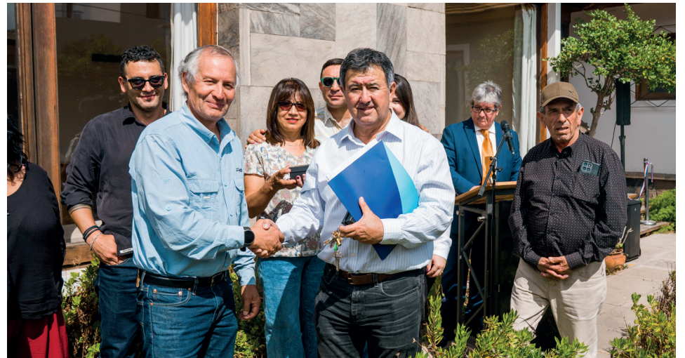
El municipio recibió en comodato la residencia estudiantil.

De esta forma, la residencia estudiantil se posiciona como un