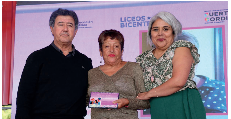
El Liceo PRVO homenajeó a las mujeres andacollinas.