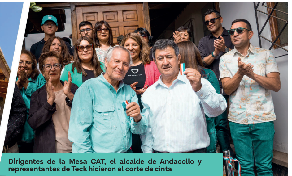
Dirigentes de la Mesa CAT, el alcalde de Andacollo y representantes de Teck hicieron el corte de cinta

La entrega del comodato entre la Mesa CAT y el Municipio de Andacollo consolida el funcionamiento de un espacio que ya acoge a estudiantes de educación superior.