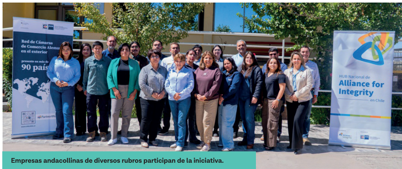
Empresas andacollinas de diversos rubros participan de la iniciativa.

Actualmente, 10 empresas locales de distintos rubros, como transporte, servicios industriales y obras civiles, participan en este proceso, que se extenderá por cerca de seis meses. Durante este periodo, cada una desarrollará herramientas concretas como códigos de ética, matrices