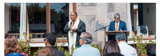
El padre bendice la nueva residencia estudiantil ante la comunidad.

aporte concreto al desarrollo del capital humano local, entregando un espacio digno, seguro y estable para las y los jóvenes de Andacollo, fortaleciendo sus trayectorias educativas y ampliando sus oportunidades de formación profesional.