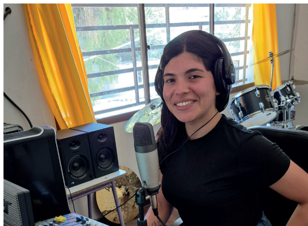
Anima las mañanas en Radio “Voces”.