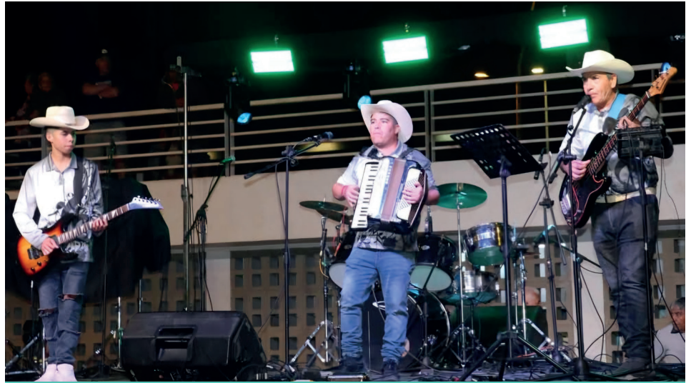
La Cumbre Ranchera puso fin al verano.

La actividad cuenta con apoyo de la Mesa CAT a través de fondos concursables, consolidándose como un espacio de encuentro familiar que pone en valor la cultura y el talento de la comuna.