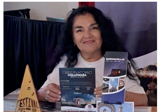
En esta edición “Semilla de Luz” y “Pueblo Amado”, creaciones del taller literario.