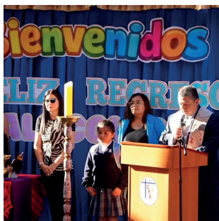
El año escolar en el Colegio Parroquial lo iniciaron con una misa.