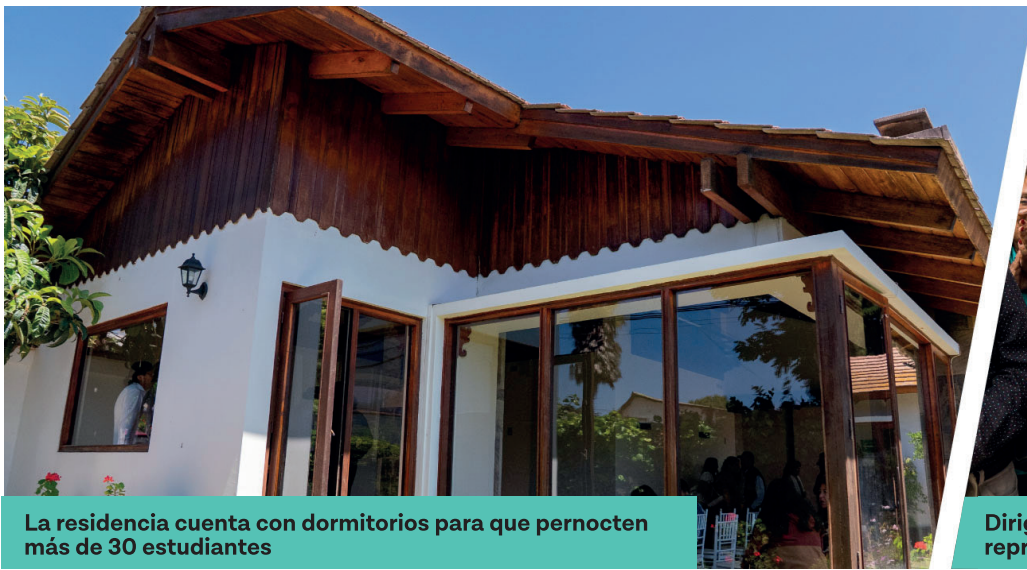
La residencia cuenta con dormitorios para que pernocten más de 30 estudiantes