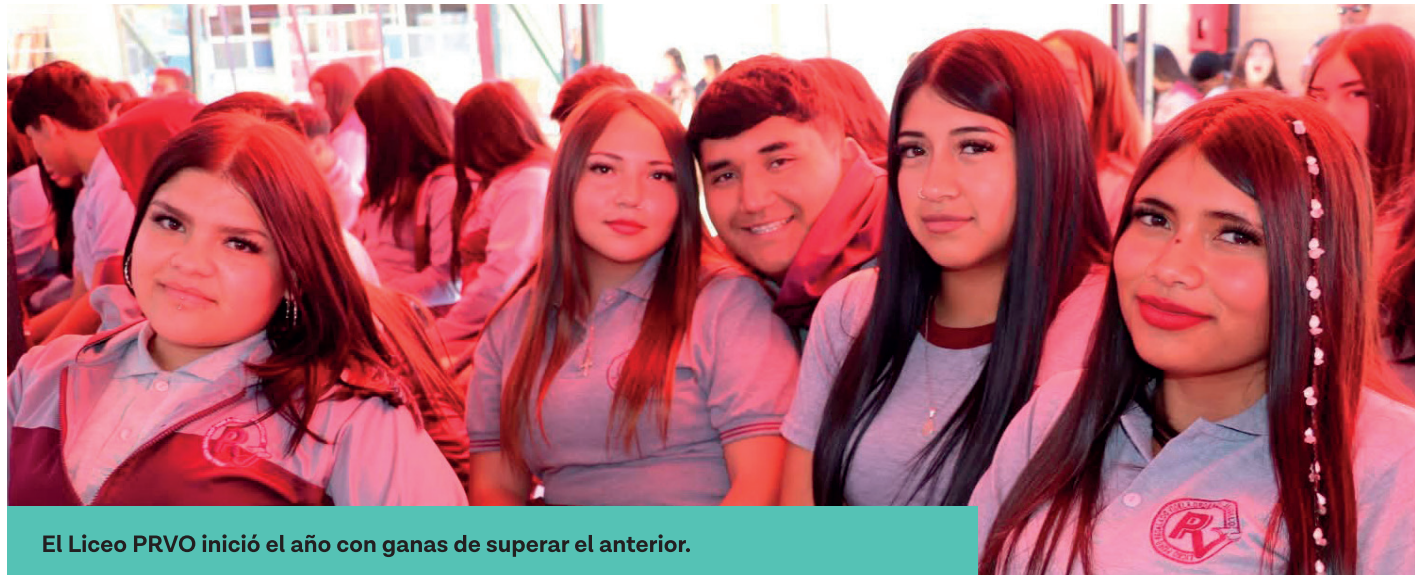
El Liceo PRVO inició el año con ganas de superar el anterior.