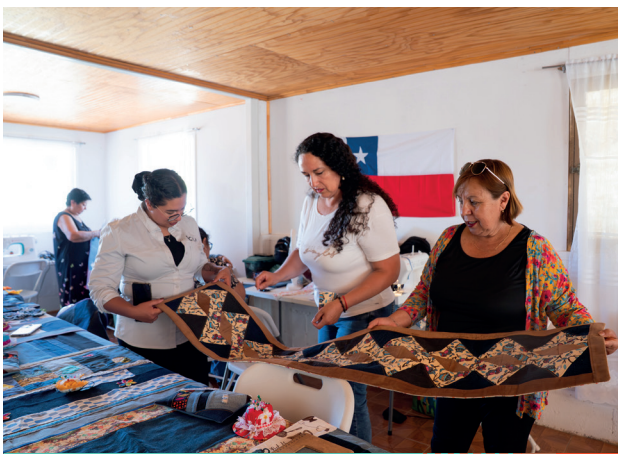
Vecinas de El Curque practican la economía circular.

“TUPANANCHISKANA”: ESCRITORES DAN VIDA A SUS EMOCIONES