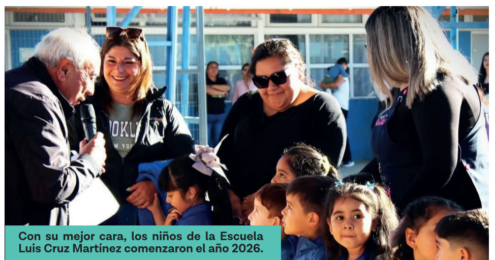
Con su mejor cara, los niños de la Escuela Luis Cruz Martínez comenzaron el año 2026.