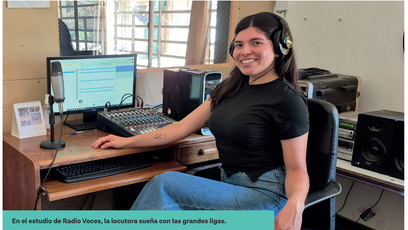
En el estudio de Radio Voces, la locutora sueña con las grandes ligas.

También se siente plena en su trabajo, "porque la gente llama y