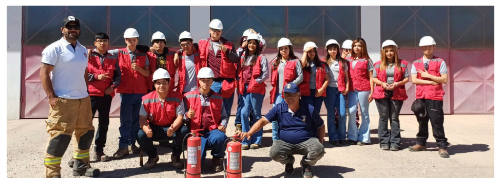
Los alumnos del Liceo PRVO aprendieron el correcto uso de los extintores de parte de bomberos.

este tipo de capacitaciones son gratuitas y abiertas a la comunidad, por lo que hicieron un llamado