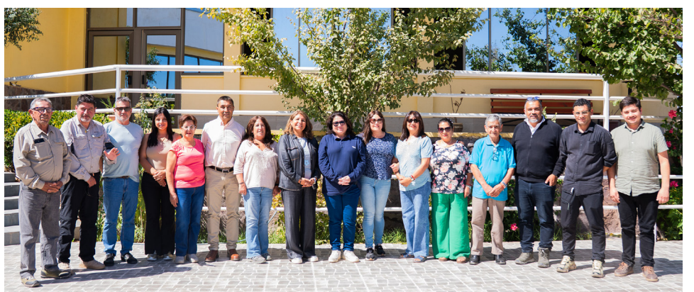
También es un activo participante de la Mesa CAT en representación del Sindicato de Pirquineros.

con cerca de 150 mineros y unas 60 faenas regularizadas, avanzando de forma paralela en la formalización del sector.