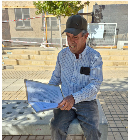
El dirigente minero con la documentación de la futura planta tecnológica.

Terreno en comodato por 5 años (otorgado por Teck). $350 millones aportados para estudios (Mesa CAT). Avance actual: 40%. Meta: estudios y permisos listos en octubre. Inversión estimada para la planta: $4.000 millones.