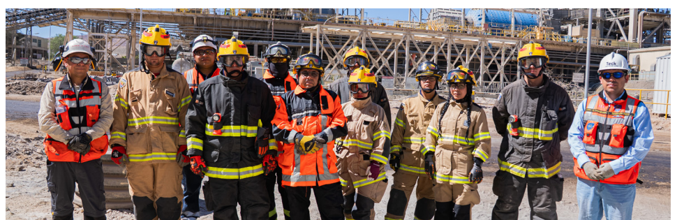
El apoyo de bomberos contribuye a una rápida reacción ante emergencias.

emergencias, asegurando un entorno más seguro tanto para quienes participaron en las labores como para la comunidad.