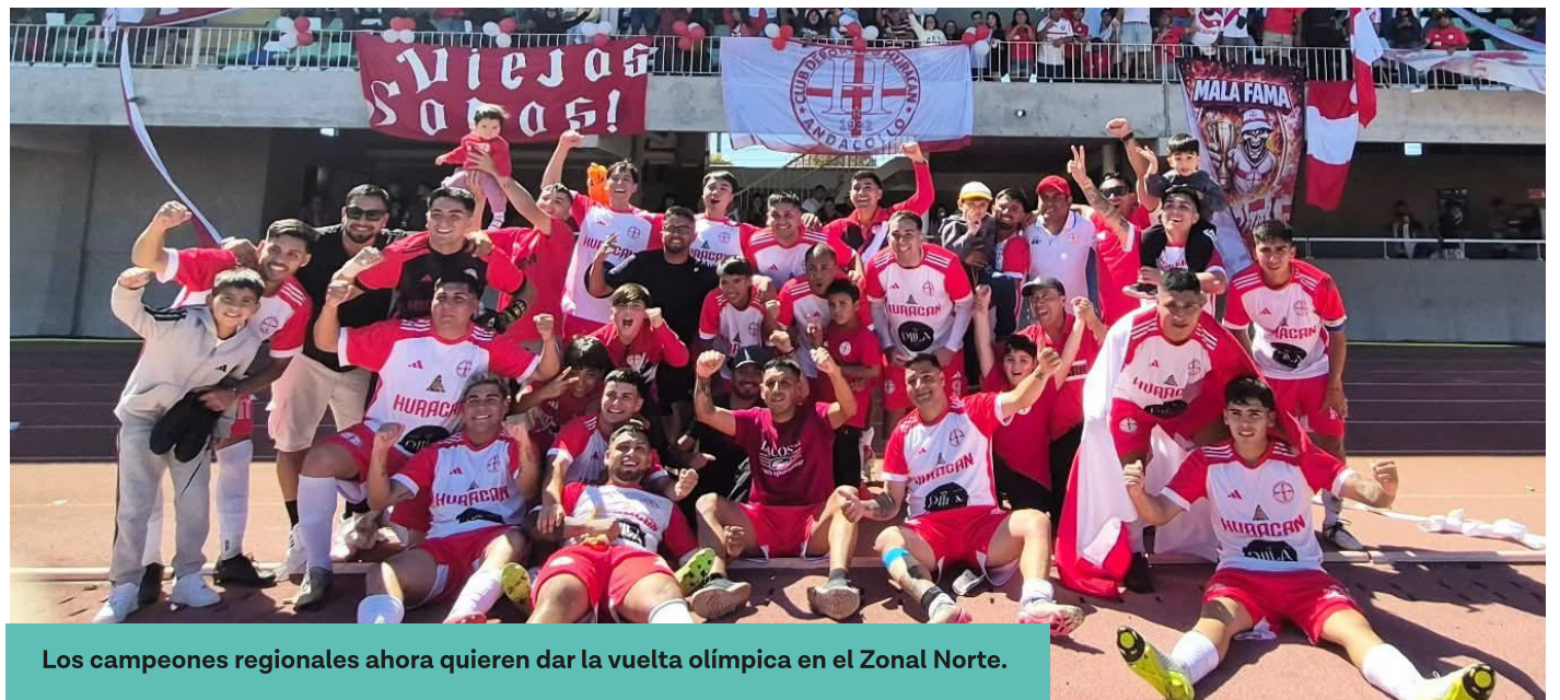
Los campeones regionales ahora quieren dar la vuelta olímpica en el Zonal Norte.