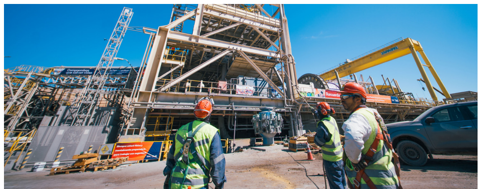
Fueron seis jornadas de trabajo continuo.

En esa línea, el trabajo conjunto con el Cuerpo de Bomberos de Andacollo permitió reforzar protocolos y preparar respuestas ante eventuales