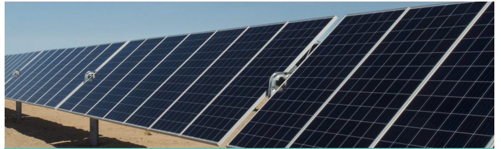
Serán más de 24 mil paneles los contemplados en el proyecto.

Uno de los aspectos más relevantes del proyecto es la incorporación