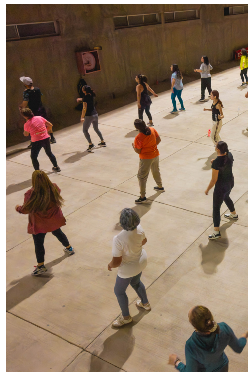
El horario vespertino fue ideal para la realización del taller.

no solo promovió hábitos saludables, sino que también fortaleció el tejido social, reafirmando el valor de iniciativas comunitarias apoyadas por la Mesa CAT para el desarrollo integral de Andacollo.