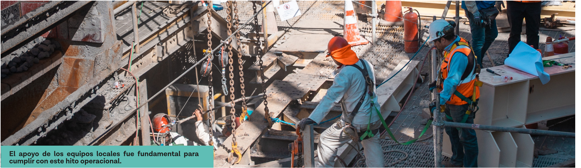
El apoyo de los equipos locales fue fundamental para cumplir con este hito operacional.

La llegada de más de 1.600 trabajadores y trabajadoras durante la Mantención Mayor activó una cadena productiva local que fortaleció el comercio, la hotelería y los servicios, generando un impacto directo en el dinamismo económico de la comuna.