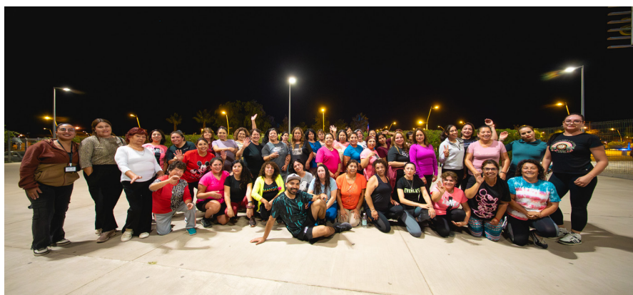
Más de 60 mujeres participaron activamente del taller.

El taller destacó por su alta convocatoria y compromiso. “Esta