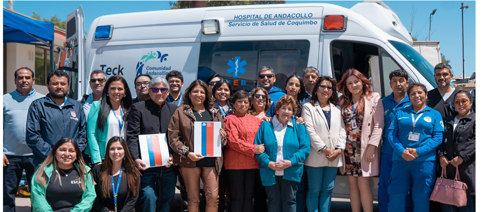
La directora recibió por parte de la Mesa CAT una ambulancia para uso del hospital.

El trabajo se complementa con el fortalecimiento de la flota vehicular, gracias a gestiones con el Gobierno Regional y aportes en comodato del